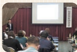
第4回 ふくい電子納税プロジェクト