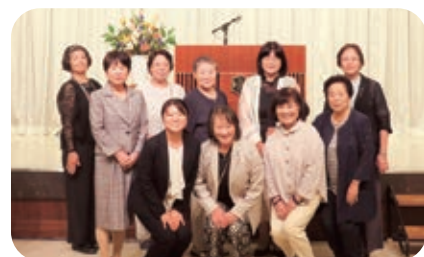
敦賀法人会女性部会

福井県法人会連合会女性部会連絡協議会では、県内女性部会の交流を図るため、毎年もちまわりによる研修会を開催しています。今年は、南越法人会主管の研修会に、敦賀から12名で参加しました。第1部のオープニングでは、法人会理念の唱和があり、南越法人会部会長からの歓迎のお言葉、福井県法人会連合会 女性部会連絡協議会会長と武生税務署長のご挨拶のあと、活動報告がありました。第2部は、福井電子納税プロジェクトについての講義と、お茶を頂きながらの交流の時間が設けら