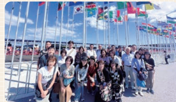
西口ゲート前にて集合写真