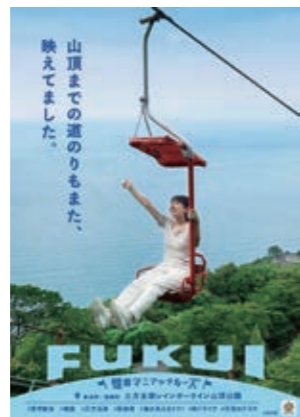
22 レインボーライン山頂公園 三方五湖を一望できる 天空のテラス