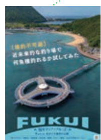
16 あかぐり海釣り公園