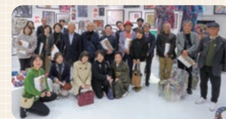
完成されたアート作品をバックにみんなで集合写真

昼食は滋賀県と言えば近江牛!天保10(1839)年創業の老舗「岡喜本店」にて、美味しいすき焼きを堪能しました。昼食後は、バームクーヘンで有名な「たねやクラブハリエ」の旗艦ショップ店「ラコリーナ近江八幡」へ。小雨が降り出し雨模様を心配しましたが、おいしい香りに誘われてお買い物の行列に並ぶ頃には晴れ間が見え、草に覆われた建物や森への小道の散策を楽しみながら、冬季限定の赤い箱のクリスマスバームをお土産に帰路につきました。