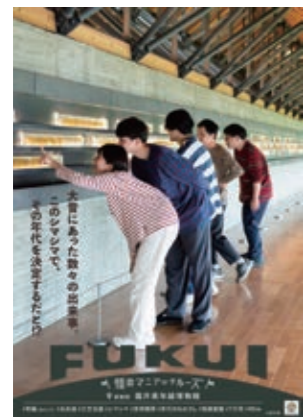
20 福井県年縞博物館 7万年に及ぶ年縞を展示 考古学会の「世界のものさし」