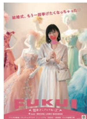
17 BRIDAL LAND WAKASA 世界的なブライダル ファッションデザイナーである 桂 由美のドレスミュージアム