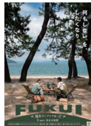
2 気比の松原 白砂青松の景勝地 日本三大松原のひとつ