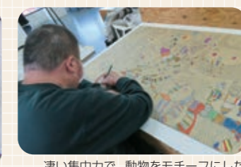
凄い集中力で、動物をモチーフにした独自の絵を作成中