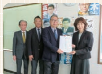
衆議院議員 高木 毅氏(代理)

当会でも、税を考える週間にあわせ、敦賀税務署管内すべての市町を訪問し、提言書を手交しました。いよいよ北陸新幹線敦賀開業が目前となり、嶺南地域の特色を活かし、地元経済の活性化、魅力ある街づくりの重要性などについて貴重な意見交換の場となりました。