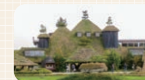
まるでジブリの世界のよう...雰囲気のあるラコリーナの外觀