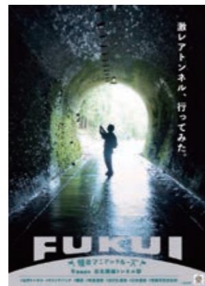
12 旧北陸線トンネル群 明治の土木技術の粋が 詰まった11基のトンネル群