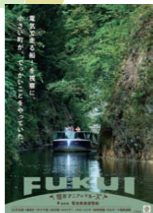
14 電池推進遊覧船 再生可能エネルギーで進む 三方五湖の遊覧船